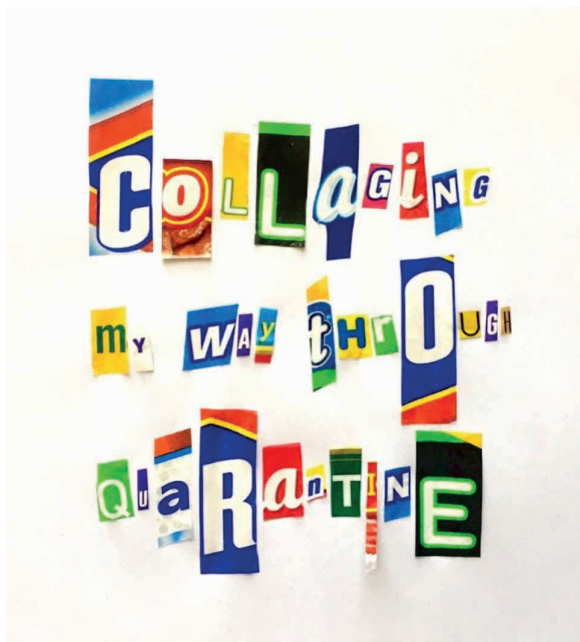
Exemples photos tirés de l'Instagram de l'artiste : @Arielakader, Mars 2020